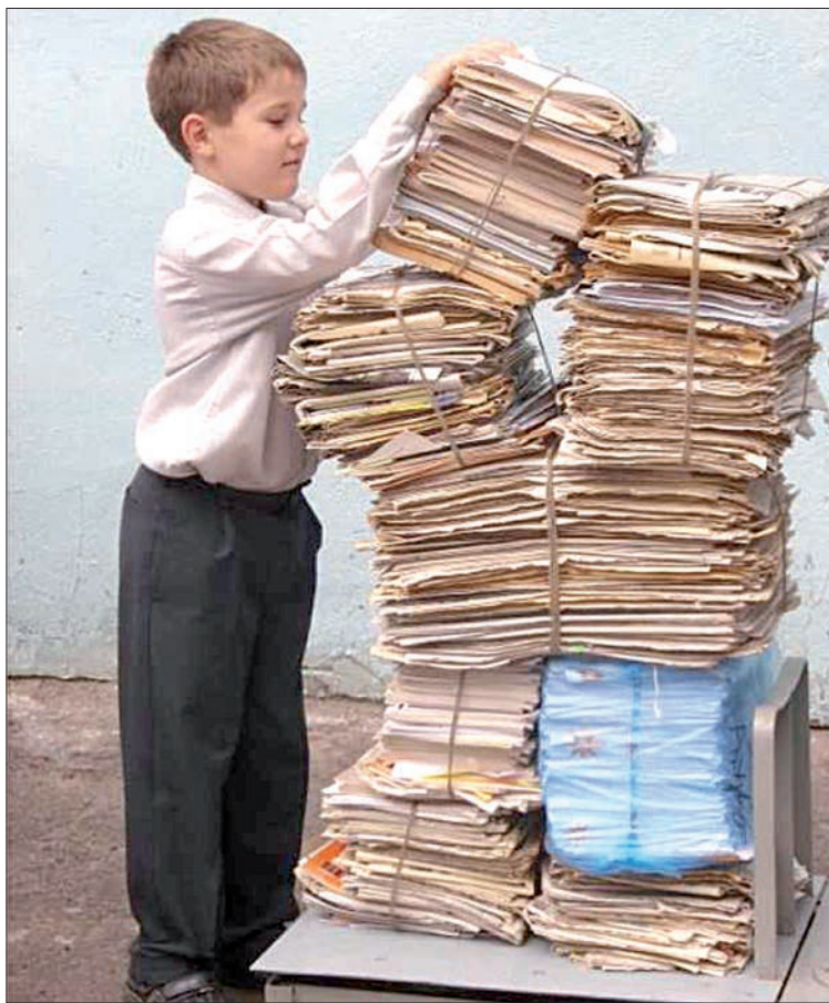
Макулатурные соревнования канули в Лету.