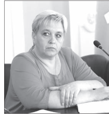
Все ребята из 43-й школы уже учатся в других школах.