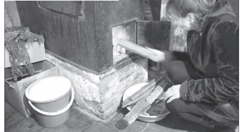
... «и дома было тепло».