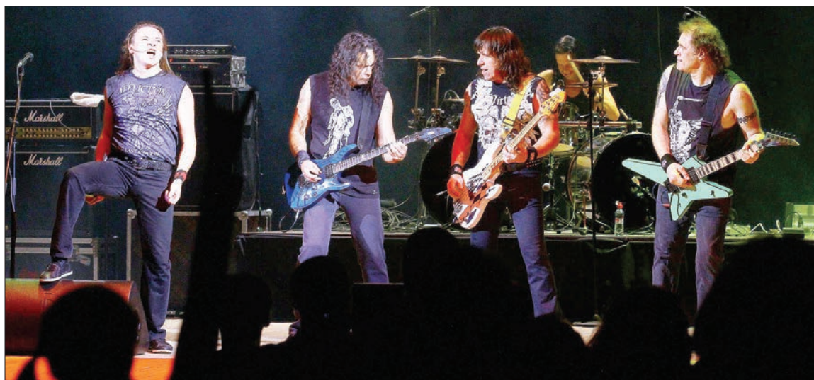
Концерт получился на редкость разнообразным – лирические композиции из «Феникса» плавно сменяли жесткие рифы песен из альбомов середины 90-х.

В основу сет-листа ульяновского концерта легли композиции, выбранные самими поклонниками «Арии», которые в течение месяца голосовали на сайте группы за желанные песни. Некоторые из песен уже давно не звучали вживую. Концерт получился на редкость разнообразным – лирические композиции из «Феникса» плавно сменяли жесткие рифы песен из альбомов середины 90-х. За свою историю группа «Ария» сменила около