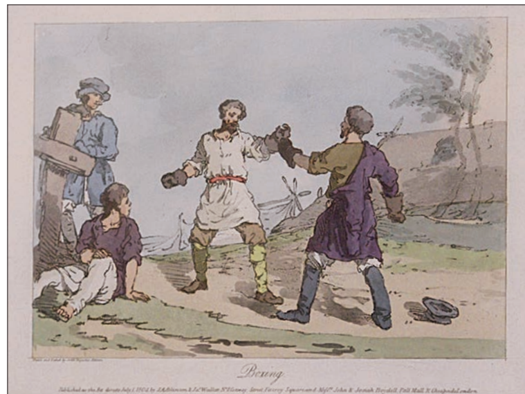
Дж. Аткинсон «Кулачный бой».

...Вы не попали в театр, кино, на выставки и концерты? Сами виноваты!