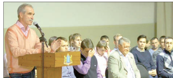
Встреча с хоккейной «Волгой».

С утра в зале заседаний правительства губернатор провел совещание по созданию общественного совета «Духовность. Милосердие. Благотворительность». А затем в центре татарской культуры принял участие во II съезде учителей татарского языка. Подписано соглашение между Минобразования и науки области и Республики Татарстан.