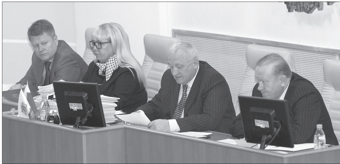
Главной темой заседания ЗСО стал поиск дополнительных доходов.

Проект бюджета был составлен на основе прогноза социально-экономического развития на 2014 год. Исходя из него предполагается, что индекс объема физического валового регионального продукта составит