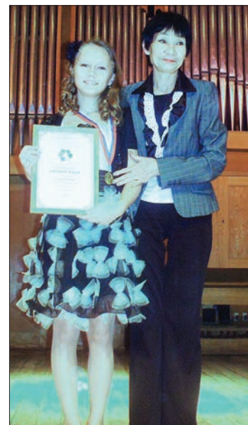
Побеждают и ученики, и педагоги.

P.S. Полный список победителей будет размещен на сайте областной детской школы искусств ( http://ulodshi.tw1.ru )