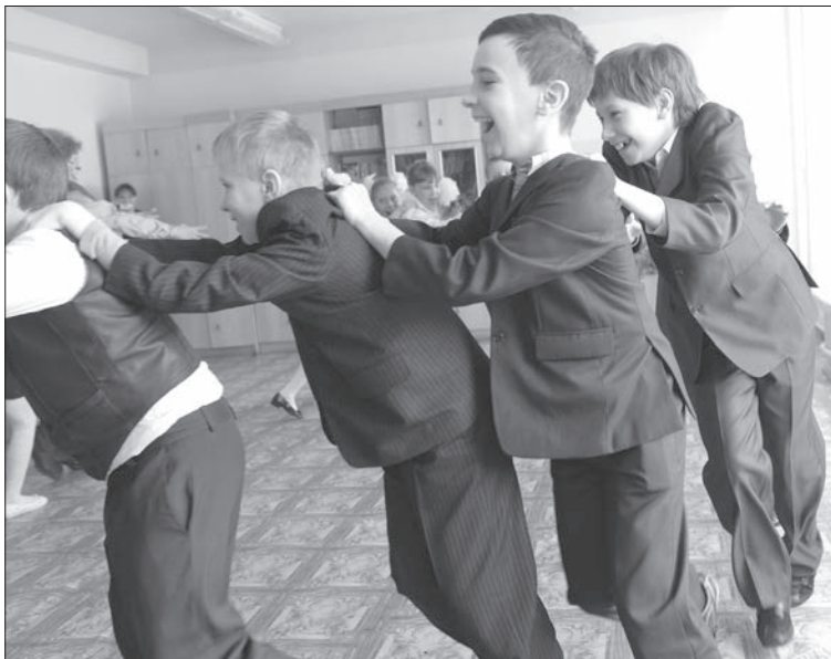
Смена статуса здания школы № 43 никак не повлияла на учебный процесс.

селению по городу Ульяновску – 250 посещений в смену на 10 тысяч засвияжцев.