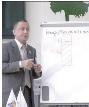
Руководство компании наглядно все объяснило.

Напомним, что «Волжская ТГК» – крупнейшая ульяновская организация, занимающаяся поставкой электричества и тепла. И не только в Ульяновской области, но и в ряде соседних регионов. Только в Ульяновске они поставляют до 80 процентов от всего тепла. Поэтому состояние энергоагрегатов, вырабатывающих энергию, важно как для областного центра, так и для всего Поволжья.