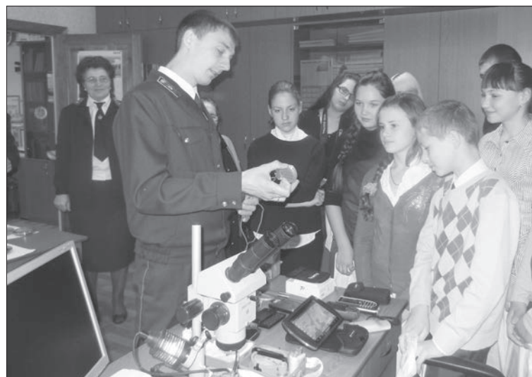
После теории для школьников началась практика в лаборатории.

В партнерстве школ и предприятий обычно выигрывают все. Особенно если оно касается того, что неотделимо от человека.