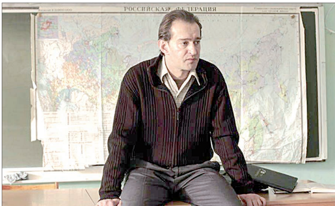
Кадр из фильма «Географ глобус пропил».

В июле нынешнего года Министерство культуры России выпустило приказ «О ежегодном проведении культурно-образовательного мероприятия «Ночь искусств» в рамках праздни-